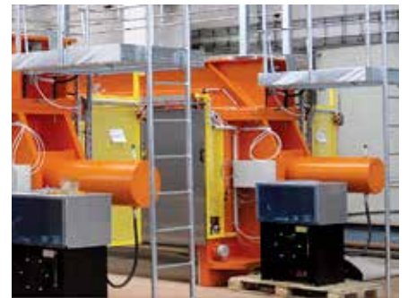
La seguridad es lo primero: El filtro prensa Flowrox siempre está equipado con cubiertas y sistemas de seguridad para garantizar un funcionamiento seguro.

Las herramientas de solución de problemas Flowrox detectan anomalías en el proceso y envían alarmas automáticamente por correo electrónico.