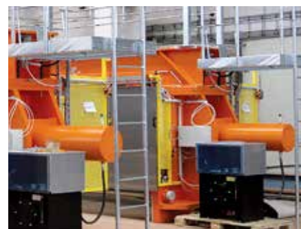
La sécurité d'abord : les filtres-presses Flowrox sont toujours équipés de protections et systèmes de sécurité pour garantir une utilisation sécurisée.

Les outils de dépannage de Flowrox détectent les anomalies de traitement et envoient automatiquement des avertissements par e-mail.