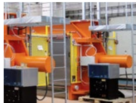
Turvallisuus on aina etusijalla: Flowrox-kammiosuodatin on varustettu suojuksilla, ja järjestelmä takaa turvallisen käytön.

Flowrox-vianmääritystyökalut havaitsevat järjestelmän poikkeamat ja ilmoittavat niistä automaattisesti sähköpostin välityksellä.